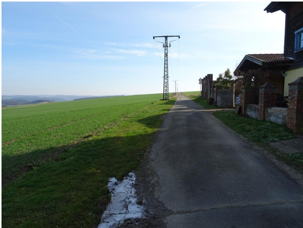
Blick nach Südosten über die Brühlstraße im Bereich des Plangebietes / Spätherbst

Südlich und westlich des Plangebietes verläuft die bituminös befestigte Straße „Brühlstraße“.