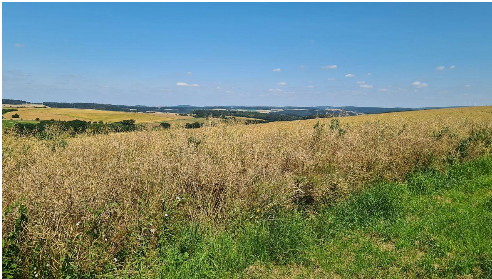
Blick über das Plangebiet in nordöstliche Richtung / Sommerbild

Die Straße „Brühlstraße“ wird im südlich zum geplanten Baugebiet bestehenden Verlauf als Einstieg in die ortsnahe Erholung und die Ausführung von Hunden intensiv genutzt. Das Plangebiet besitzt damit mäßig hohe Bedeutung als Kulisse für die Naherholung sowie für den Wohnwert. Bei einem geringen Vielfältigkeitswert der Landschaft ist aufgrund der Wegeverbindungen der Bereich erlebbar und Bestandteil des Naherholungsraumes um Winterwerb.