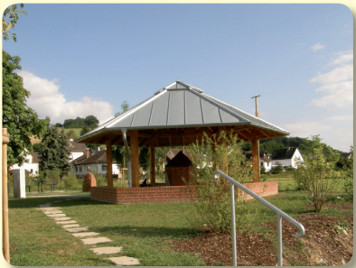
Antoniusbrunnen in Rückerhausen