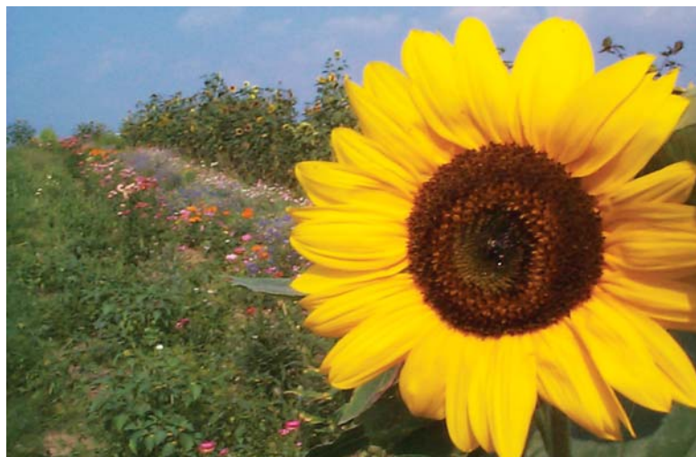
Foto: Sonnenblumenfeld, Hahlgartener Hofladen, Frücht