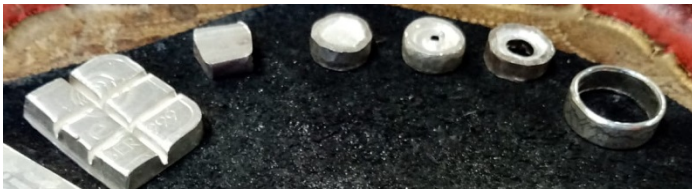
Die Entwicklung des Silbers vom ursprünglichen Block hin bis zum fertigen Ring.